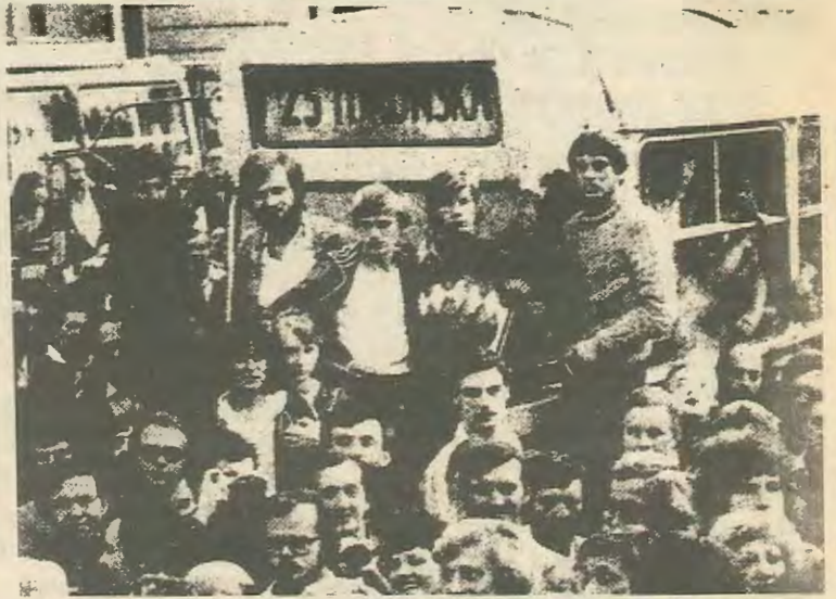
Οι Πολωνοί διαμαρτύρονται για τις ελλείψεις τροφίμων. Η γραφειοκρατία τους κατηγορεί ότι εξυπηρετούν τον Ιμπεριαλισμό

Οι νόμιμες ενώσεις δεν θα μπορούν να συμμετέχουν σε καμία πολιτική δραστηριότητα και θα είναι υποχρεωμένες να πληροφορούν τη κυβέρνηση για οποιαδήποτε απεργία μια βδομάδα πριν από την ημέρα της πραγματοποίησής της και να ματαιώνουν κάθε απεργία τους